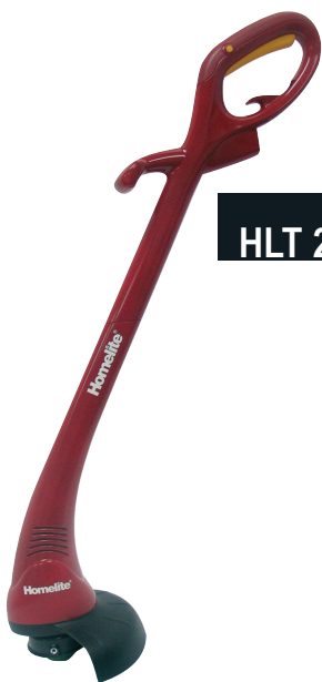
HLT 2523 250 Watt