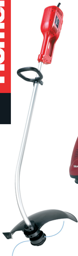
HLT 6038 600 Watt