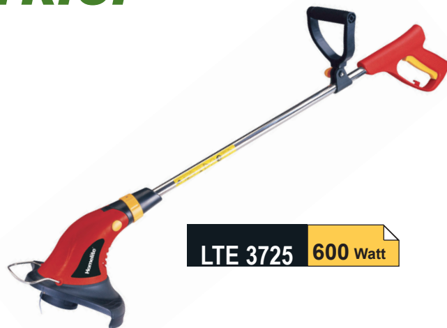
LTE 3725 600 Watt