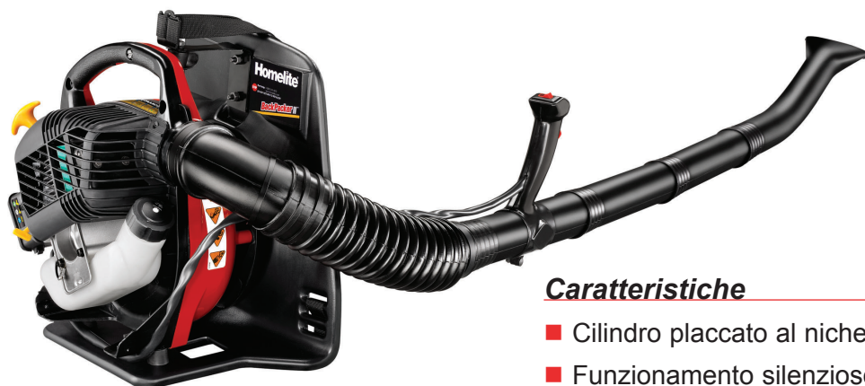
HBP 30 30 cc